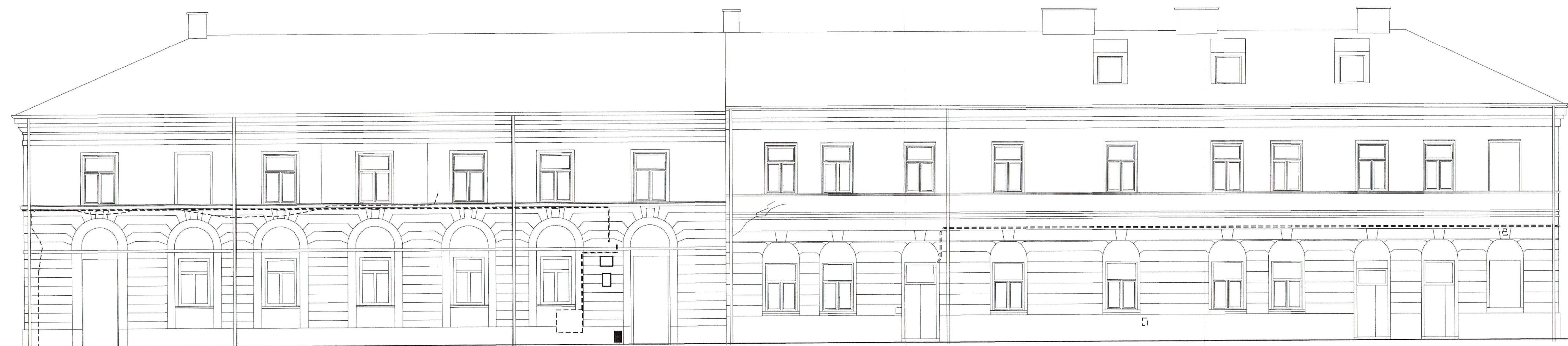
ELEWACJA OD STRONY ULICY RWAŃSKIEJ