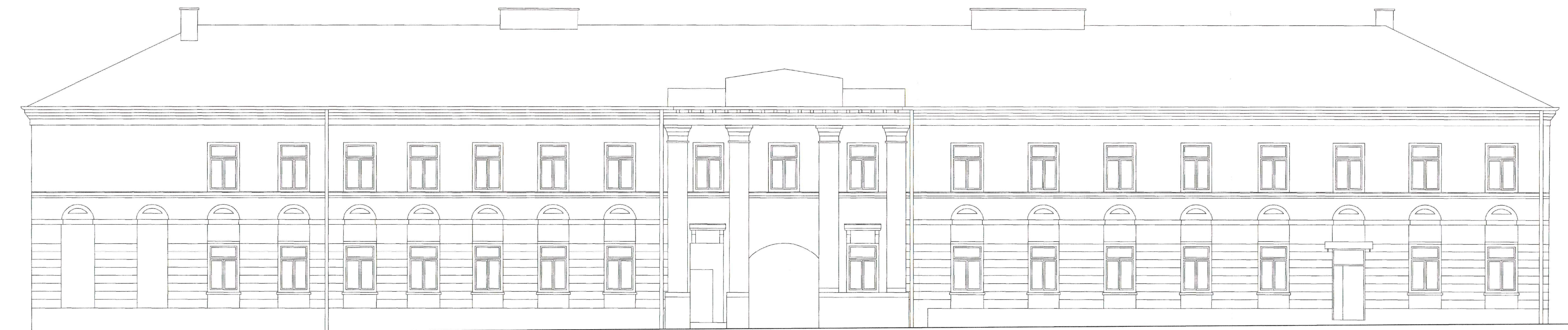
ELEWACJA OD STRONY ULICY GRODZKIEJ