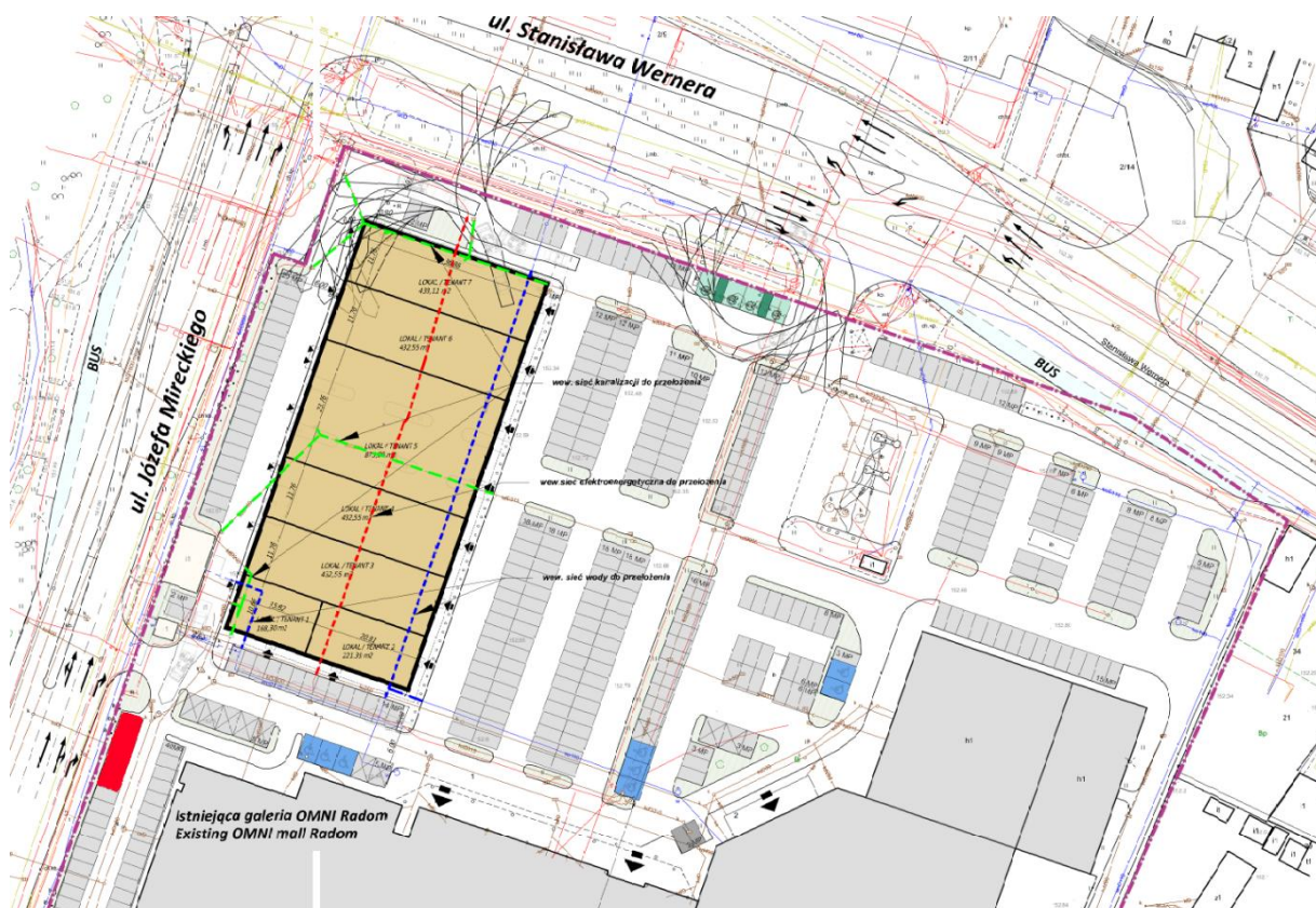
Rys.4 Koncepcja zagospodarowania terenu.