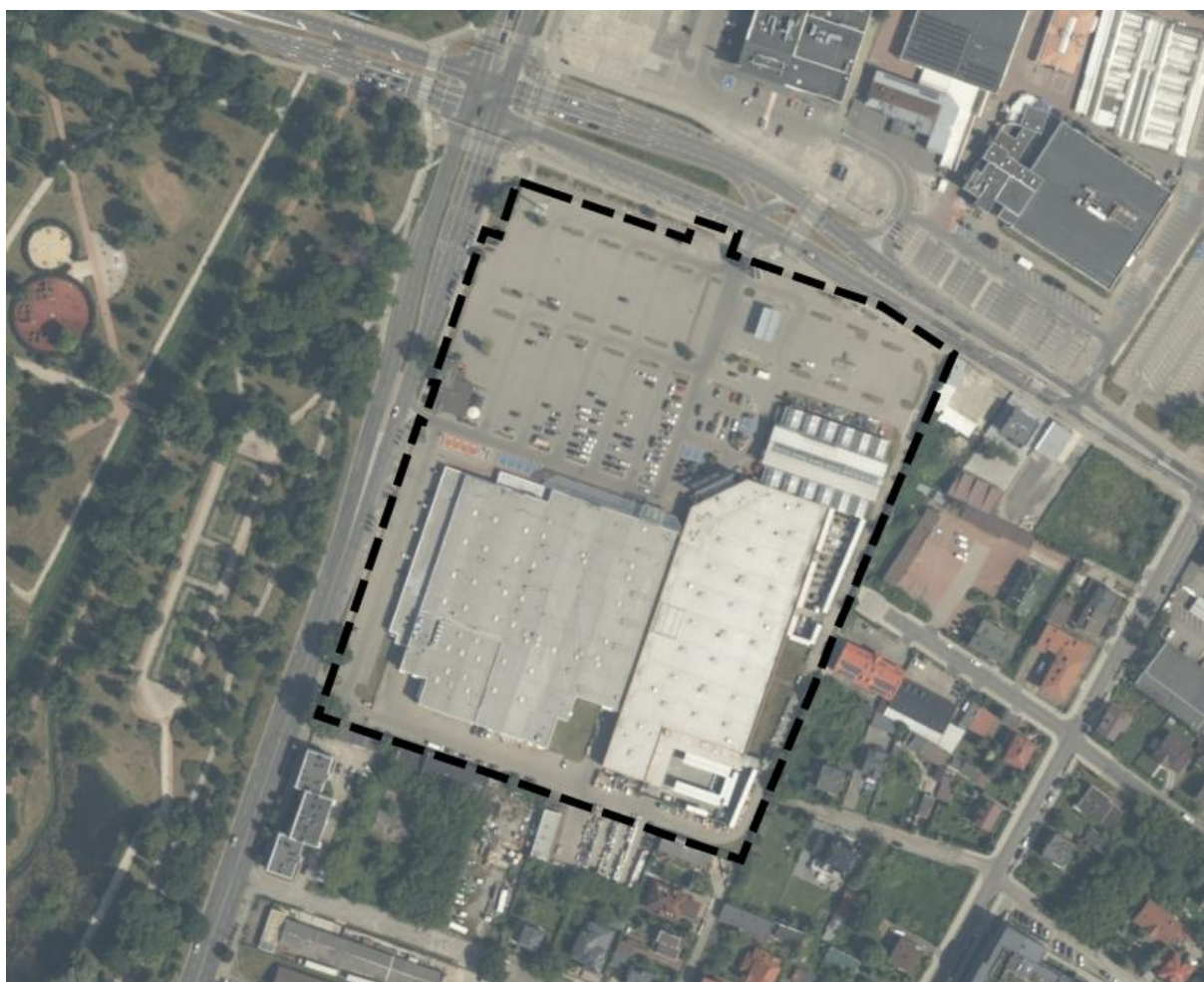
Rys.1 Lokalizacja kompleksu usług objętego wnioskiem na tle ortofotomapy

Teren jest wypełni wyposażony w konieczną infrastrukturę techniczną.