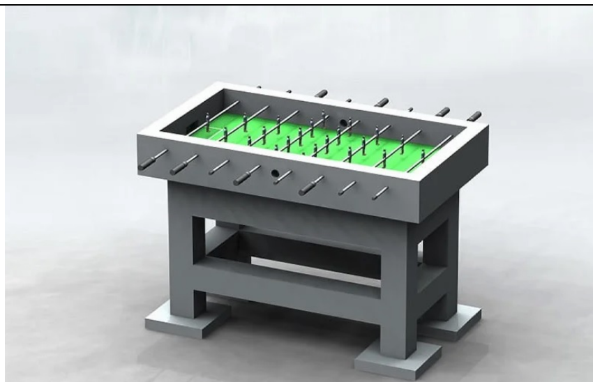
Załączniki (pole nieobowiązkowe)