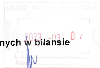
Tabela 1.11. Otrzymane gwarancje i poręczenia niewykazanych w bilansie