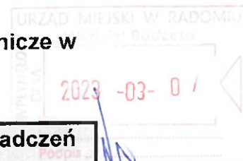
Tabela 1.12. Wyplacone środki pieniężne na świadczenia pracownicze w roku 2022