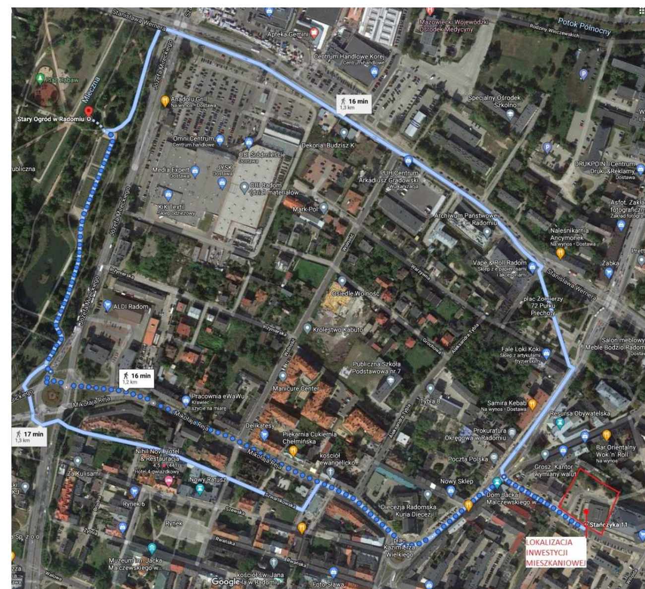
Stary Ogród w Radomiu