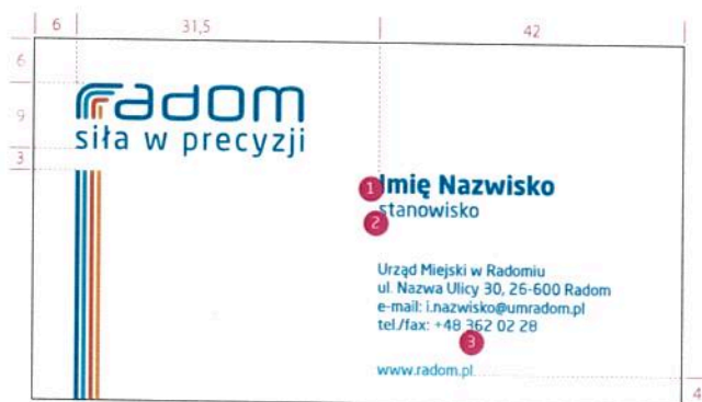
bilet wizytowy imienny – front